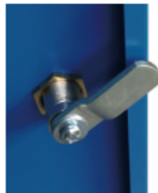
Fermeture 1 point