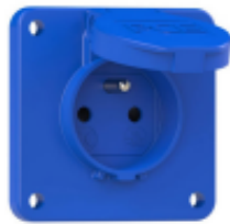
Prise IP54 230 V