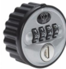
Fermeture à code mécanique