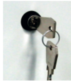
Fermeture par clé