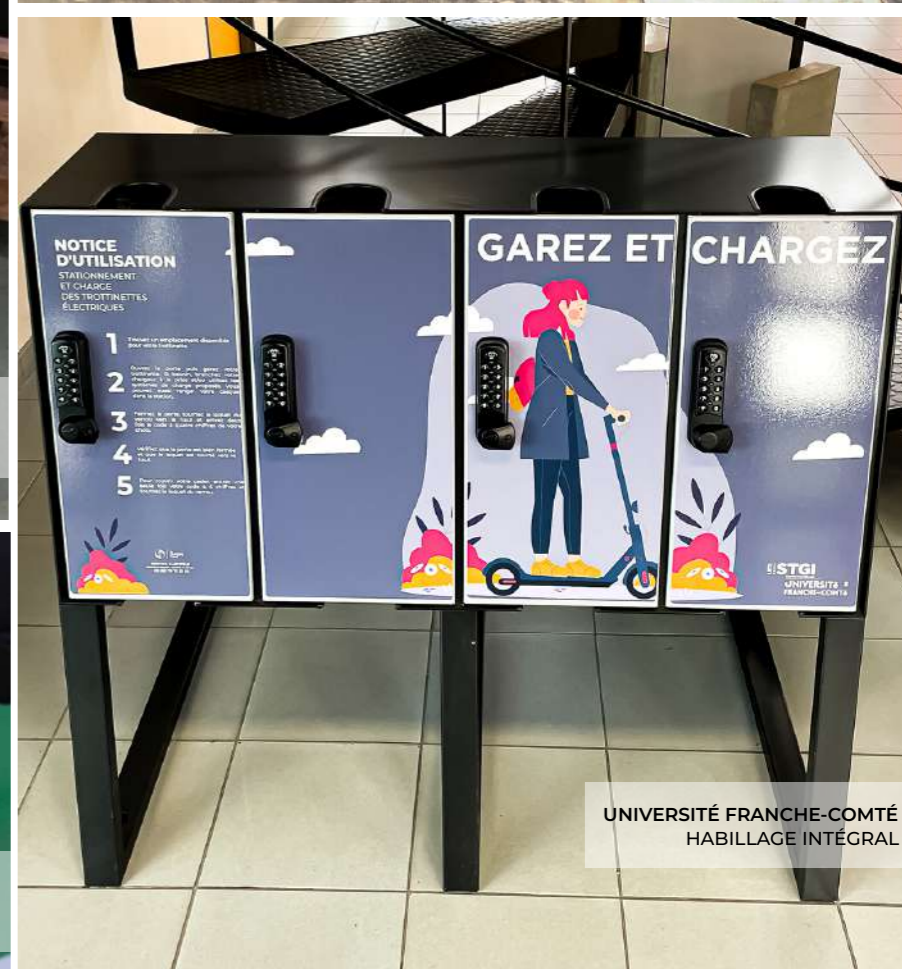
UNIVERSITÉ FRANCHE-COMTÉ HABILLAGE INTÉGRAL