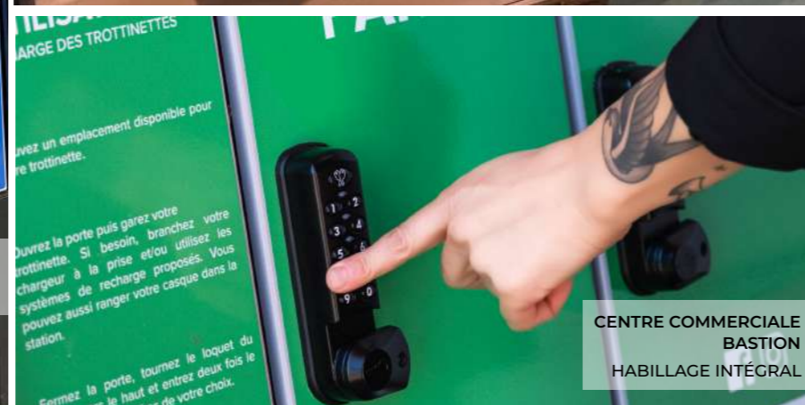
CENTRE COMMERCIALE BASTION HABILLAGE INTÉGRAL