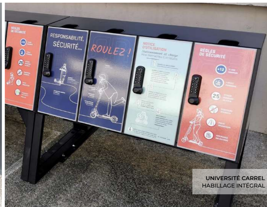
UNIVERSITÉ CARREL HABILLAGE INTÉGRAL