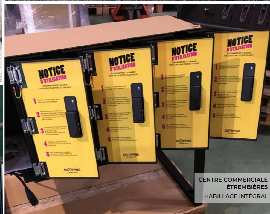
CENTRE COMMERCIALE ÉTREMBIÈRES HABILLAGE INTÉGRAL