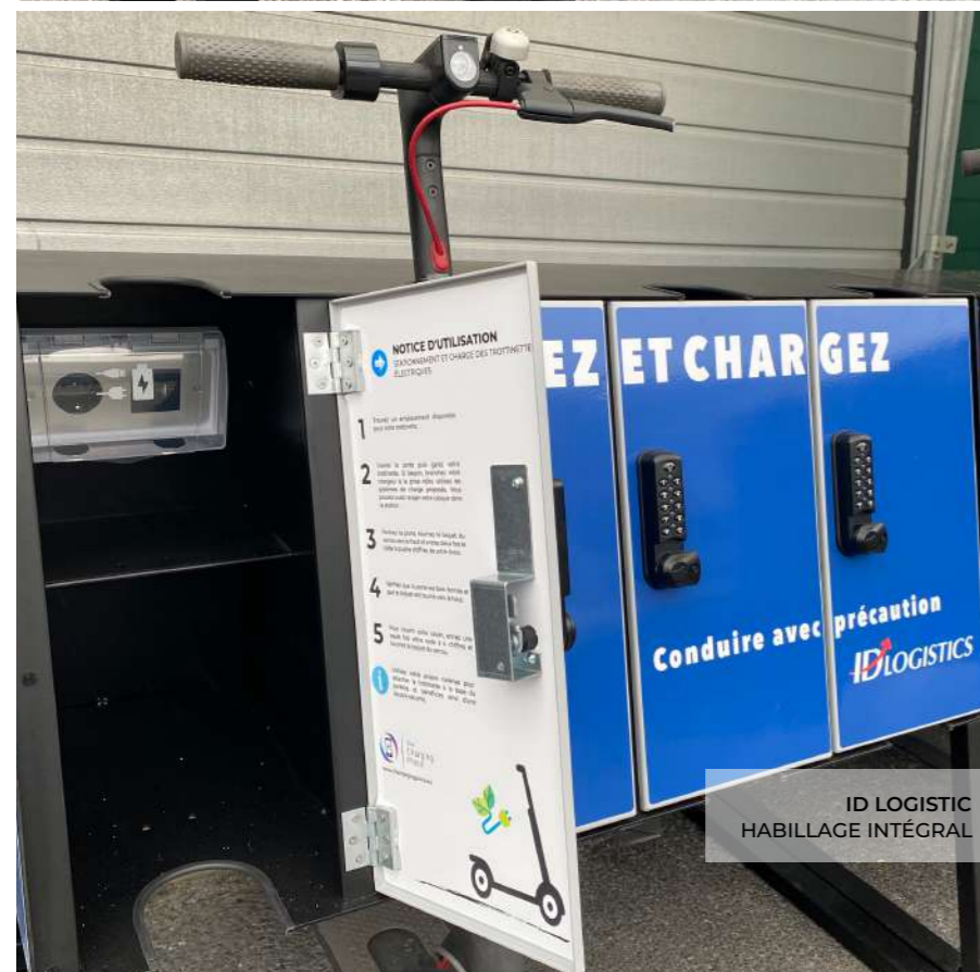
ID LOGISTIC HABILLAGE INTÉGRAL