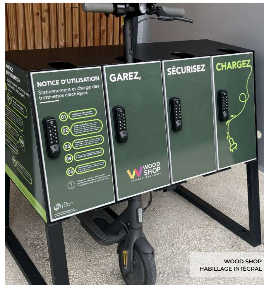
WOOD SHOP HABILLAGE INTÉGRAL